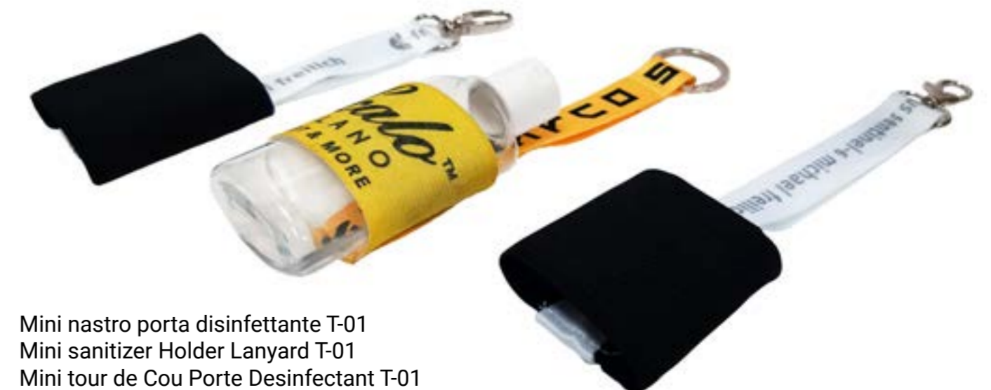
Mini nastro porta disinfettante T-01 Mini sanitizer Holder Lanyard T-01 Mini tour de Cou Porte Desinfectant T-01