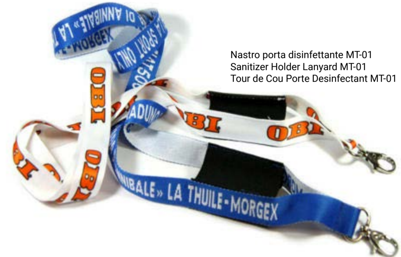
Nastro porta disinfettante MT-01 Sanitizer Holder Lanyard MT-01 Tour de Cou Porte Desinfectant MT-01