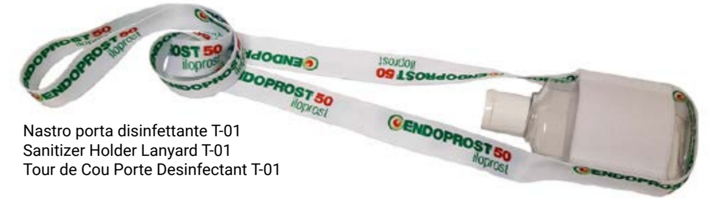
Nastro porta disinfettante T-01 Sanitizer Holder Lanyard T-01 Tour de Cou Porte Desinfectant T-01

Disponibile anche in formato ridotto in modo da poterlo tenere in tasca, senza correre il rischio di perderlo, o da poterlo agganciare all'esterno/interno di una borsa.