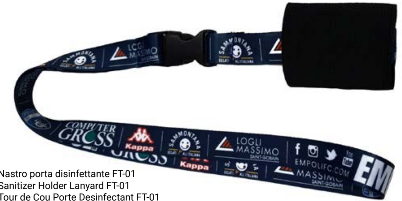
Nastro porta disinfettante FT-01 Sanitizer Holder Lanyard FT-01 Tour de Cou Porte Desinfectant FT-01

La mini ruban porte desinfectant est également disponible et vous-pouvez garder dans votre poche, sans courir le risque de le perdre, ou de l'accrocher à l'extérieur / à l'intérieur de votre sac.